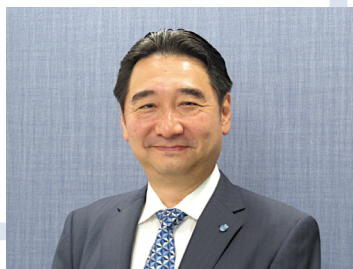
内田会計グループ 代表 長崎オフィス 所長

投票率の低さは、自分ひとりがやらなくても、と考える人が多いことのサインのように思います。日本企業が全体として弱体化していることと、投票率が下がっていることは、根っこで繋がっているのかもしれない。