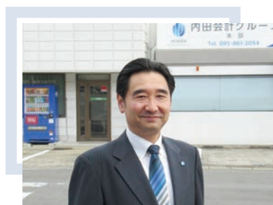
内田会計グループ 代表 長崎オフィス 所長

3月になり寒さも和らいできましたが、寒暖差の激しい時季でもあります。皆様も体調にお気をつけて、新しい春を元気にお迎えください。