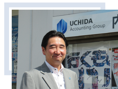
内田会計グループ 代表 長崎オフィス 所長

簿記会計の仕組みはよくできていて、横領などがあればいつかどこかで矛盾が出て発覚します。最後は会社には損害、本人は懲戒解雇となり、お互いに不幸しかありません。未然に防ぐに越したことはないと思います。