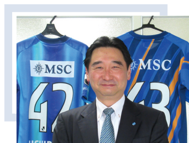
内田会計グループ 代表 長崎オフィス 所長

オフィスが遠くなることで不安になられるお客様もおられるかもしれませんが、より良いサービスを提供するためですので、何卒ご理解のほどをお願いいたします。今後とも内田会計グループをよろしく願い申し上げます。