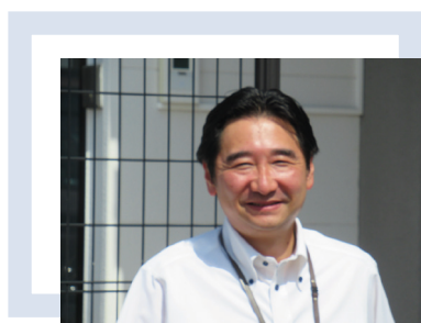
内田会計グループ 代表 長崎オフィス 所長

日本人はよく「おかげさまで」という言葉を使いますが、日本人の考え方が現れた素晴らしい言葉だと思います。単なる枕詞として使うのではなく、お世話になっている方々への感謝の気持ちと、これまでお世話になった方々から受けた恩を噛み締めながら使いたいと思います。